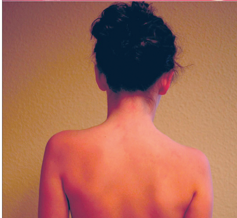
Paciente con mala oclusión que está causando desviación de la columna.